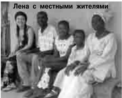
Лена с местными жителями