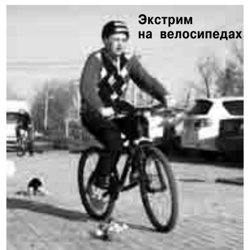
Экстрим на велосипедах

- Как проходил лагерь, каковы его итоги?