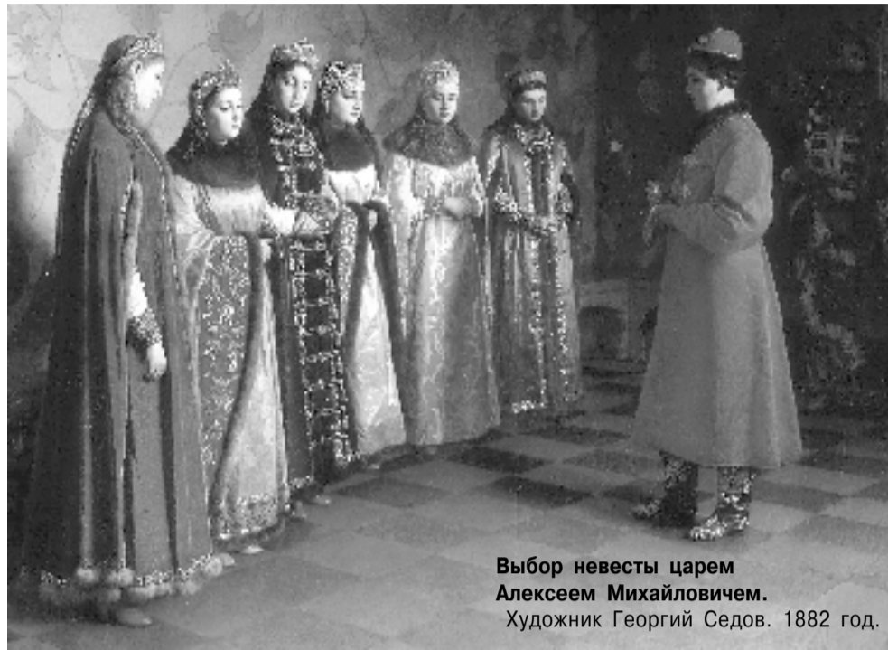
Выбор невесты царем Алексеем Михайловичем. Художник Георгий Седов. 1882 год.

Вы выбираете невесту, не понимая, что именно нужно женщине. Если это так,