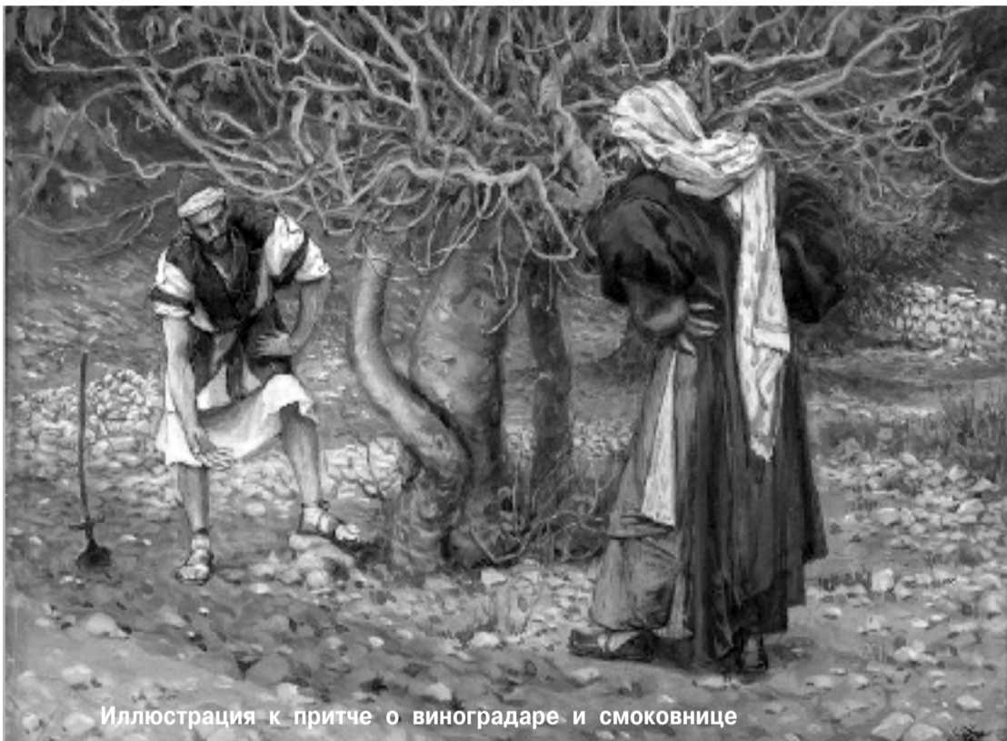
Иллюстрация к притче о виноградаре и смоковнице