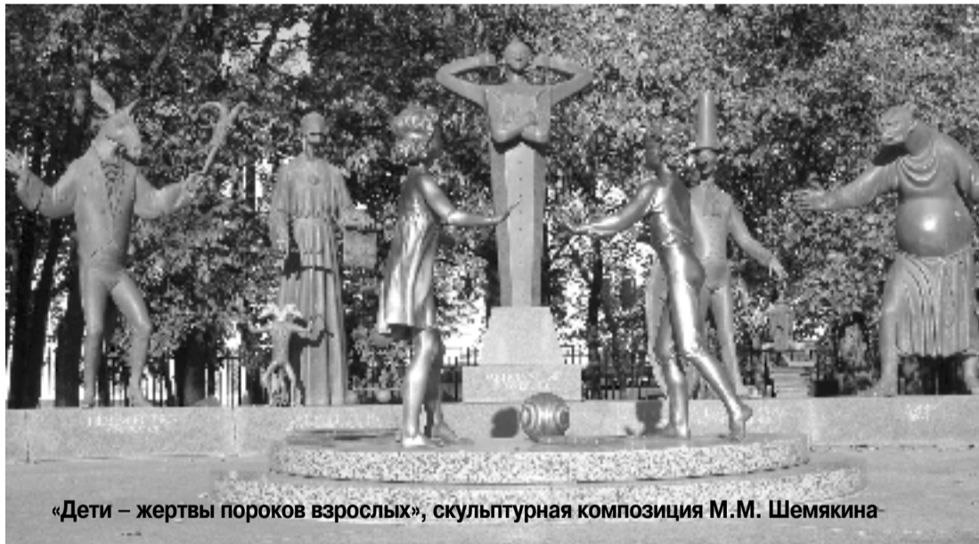
«Дети – жертвы пороков взрослых», скульптурная композиция М.М. Шемякина

Интересно, что в русском литературном языке еще в XVIII в. слово «равнодушие» употреблялось в значении: «Внутреннее спокойствие, твердость, постоянство, свойство человека, которого внезапность или опасность возмутить и дух встревожить не может». А равнодушный значило: «Спокойным духом на все вззирающий. Равнодушный