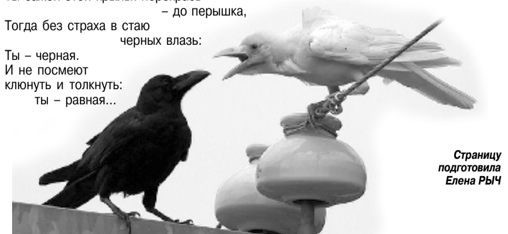
Страницу подготовила Елена РЫЧ