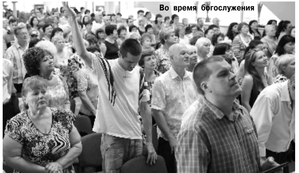
Во время богослужения

Он и в моей жизни сотворил чудо исцеления. Еще в двадцать пять лет мне поставили диагноз: рак. После проведенного лечения врачи сказали, что я проживу «целых» пять лет. Но именно через пять лет я уверовала в Господа, начала посещать церковь «Вифанию», молилась Богу. И рак отступил. С тех пор прошло девять лет. И я абсолютно здорова! У меня есть этому документальное подтверждение от врачей. Я уверена, что моя жизнь и здоровье зависят только от Бога.