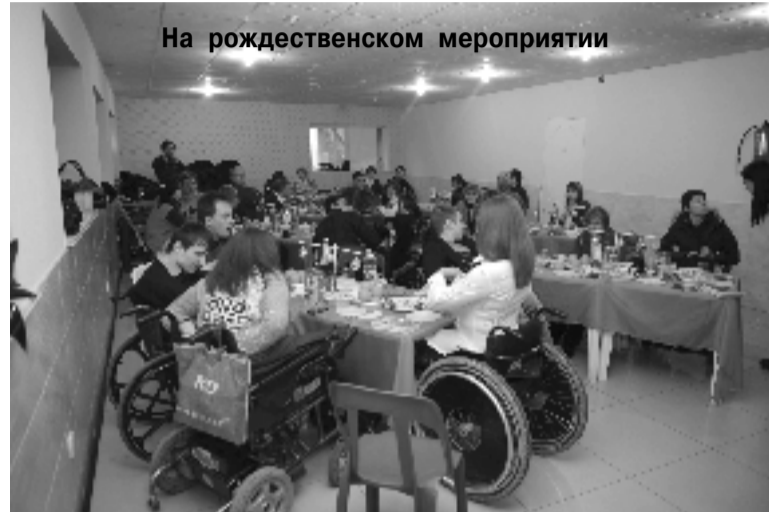
На рождественском мероприятии

– Это четвертое Рождество, которое мы провели для наших друзей инвалидов. Были приглашены гости не только из Краснодара, но и из других городов: Тихорецка, Майкопа, Таганрога. Для них мы заранее подготовили программу, нацеленную не только на развлечение и отдых, но и на познание Бога, так как большинство приглашенных – люди неверующие. Наше служение, в принципе, направлено на инвалидов, которые пока еще не посещают церковь. Очень важно дать им надежду в лице Иисуса Христа и позволить почувствовать себя принятыми Богом и людьми.