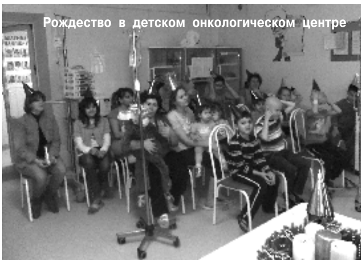
Рождество в детском онкологическом центре

«Но как к Нему обратиться, если Он остался в прошлом?» – спрашивает у маленьких зрителей ведущая. Дети заинтересованно молчат. Тогда она про-