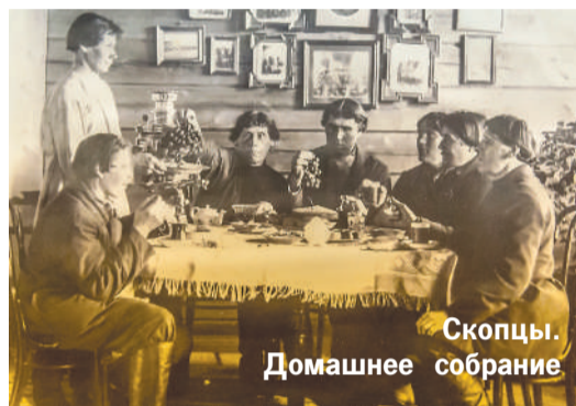
Скопцы. Домашнее собрание

В отличие от Кавказа и Украины, в Петербурге пробуждение затронуло высшее общество. Начало этому положил лорд Редсток, который в Англии посещал собрания Плимутских братьев. В Россию его пригласила великозвездская дама Елизавета Ивановна Черткова, и в 1874 году он