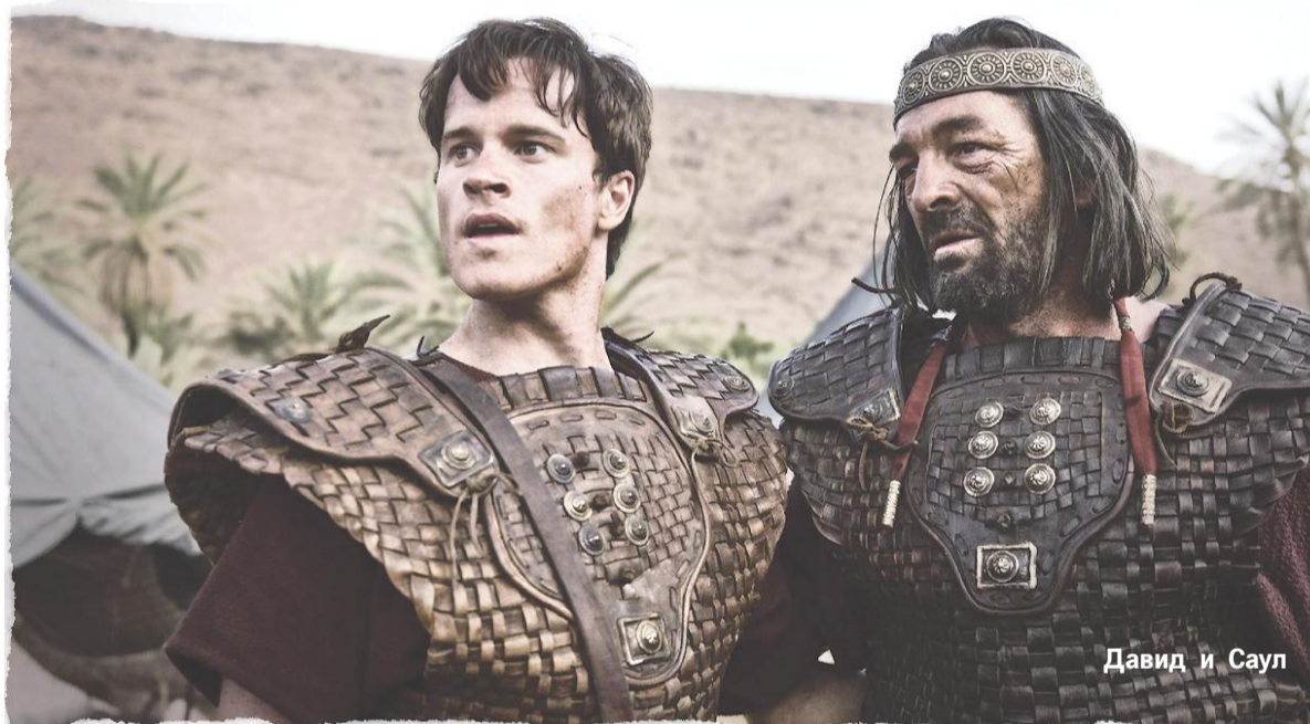
Давид и Саул

имуществу жизни по духу, а не по плоти. Еще хуже – когда пытаемся эти вещи совместить. Но здесь как раз встает вопрос нашего спасения, ибо написано: «Ибо живущие по плоти о плотском помышляют, а живущие по духу – о духовном. Помышления плотские суть смерть, а помышления духовные – жизнь и мир, потому что плотские помышления суть вражда против Бога; ибо закону Божию не покоряются, да и не могут. Посему живущие по плоти Богу угодить не могут. Но вы не по плоти живете, а по духу, если только Дух Божий живет в вас. Если же кто Духа Христова не имеет, тот [и] не Его» (Рим.е:5-9).